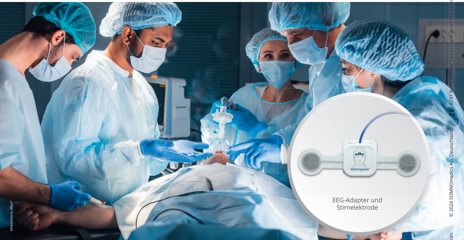
EEG-Adapter und Stirnelektrode